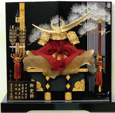
1 金小札正絹系絨(上杉謙信兜)