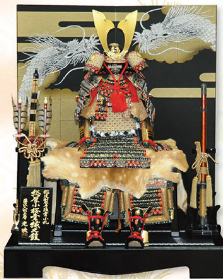
5 黒一枚張革小札小桜絨

最高級総革製 工房特別価格 税込580,000円 (間口1105×奥行69×高さ133cm)