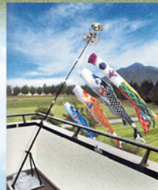
撥水加工鯉 (素材:ポリエステル)