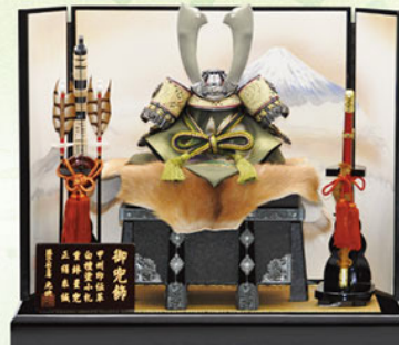
6 白檀塗小札正絹系絨