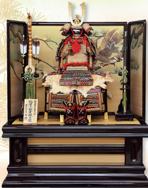
4 黒一枚張革小札小桜絨